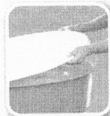
Tampe caixas d'água