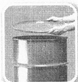
Feche bem tonéis e barris

Defenda sua família, seus vizinhos, sua comunidade. Não basta combater o mosquito. Precisamos eliminar seus criadouros e qualquer local ou recipiente que acumule água parada.