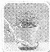
Coloque areia no pratinho dos vasos de plantas